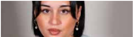
FILMVISNING AV ÄKTA MAN OCH ANDAS UNDER YTAN MERAKI STHLM | Lördag: 14:30