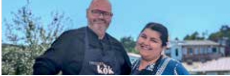
FREDDES KÖK | SVT