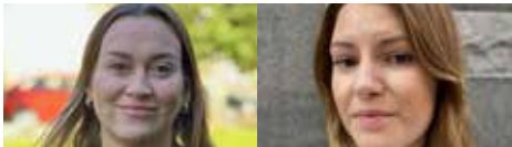
AUDISM SOM VÅLD: LÄRDOMAR OCH LÖSNINGAR Projekt Äkta man | Lördag: 15:00