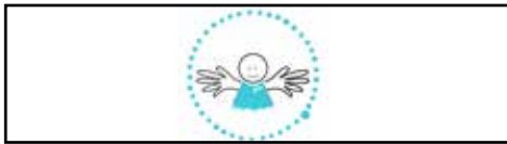
MOBILT HEM- OCH VÅRDTEAM FÖR ÄLDRE DÖVA OCH TECKENSPRÅKIGA I JÖNKÖPINGS LÄN Movadot | Lördag: 15:30

Dokumentation i form av film och foto förekommer under helgen. De kan i efterhand publiceras hos Stockholms Dövas Förening, t.ex. dess medlemstidning och socialmedier samt hos SVT, UR och Dövas Tidning.